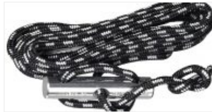
Cuerdas para Hamacas