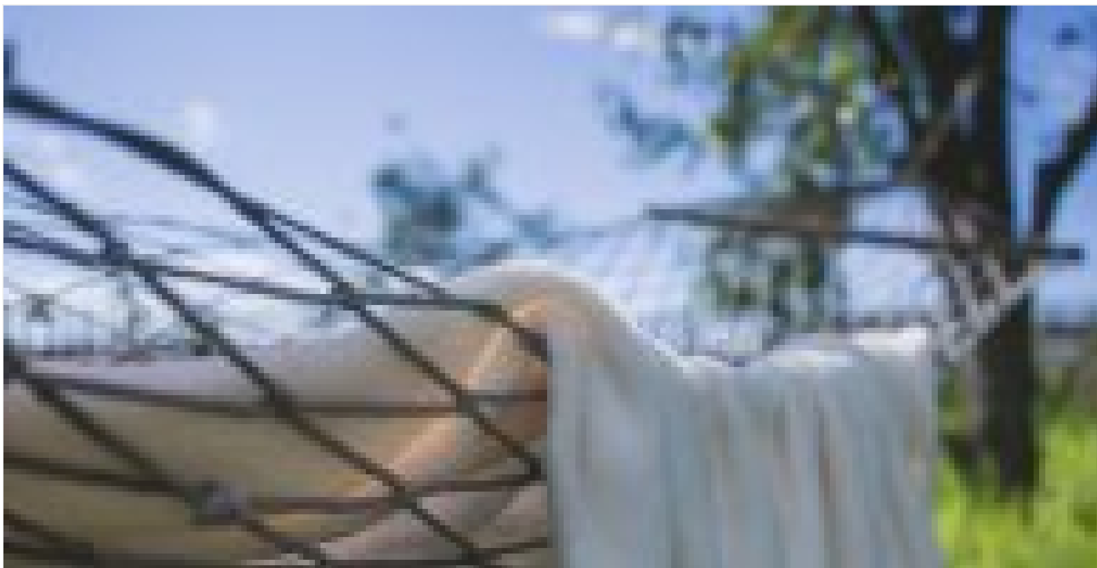
Cómo Colgar una Hamaca Paso a Paso

En este paso llega la hora de anclar la hamaca, como ayuda también tienes nuestra otra guía un poco más extensa acerca de como colgar la hamaca o balancín según la superficie y su espacio.