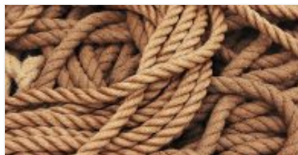
Cuerda o Soga