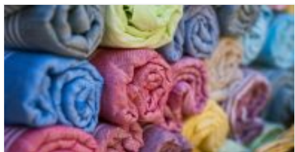
Tela o lona

Antes de comenzar, ¿sabes como se teje una hamaca? vamos a preparar una lista de materiales que vamos a necesitar a la hora de hacer una hamaca casera. A continuación tienes ideas sobre los materiales que vas a necesitar . Seguramente disfrutes de estas manualidades sencillas pero laboriosas. Aunque puedes hacerla a tu manera, esta guía es puramente orientativa. ¡Da rienda suelta a tu imaginación!