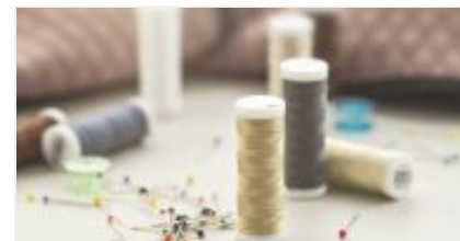
Aguja e Hilo