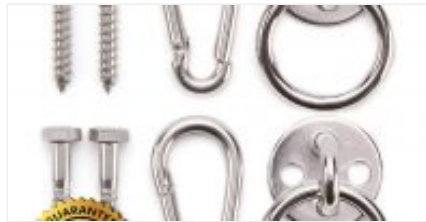
Ganchos para Hamacas

Llegó el momento de fixar la Hamaca donde tu prefieras . Puedes comprar algún tipo de anclaje , ya sea con gancho, aros , o simplemente ata tu cuerda a donde tu quieras.