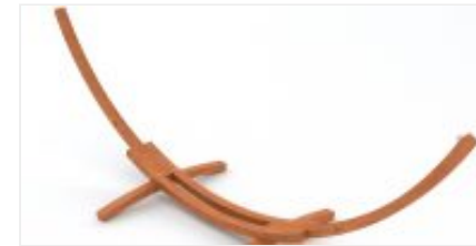
Soportes para Hamacas